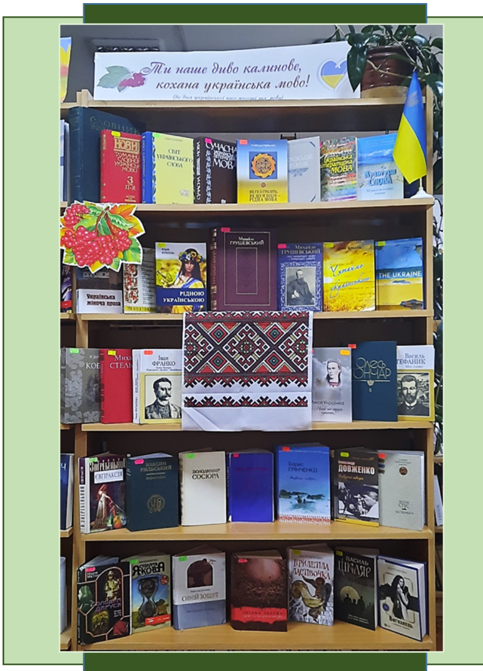
Наукова бібліотека Хмельницького національного університету

Загальні питання: centr@khnmu.edu.ua Публікація матеріалів: press@khnmu.edu.ua